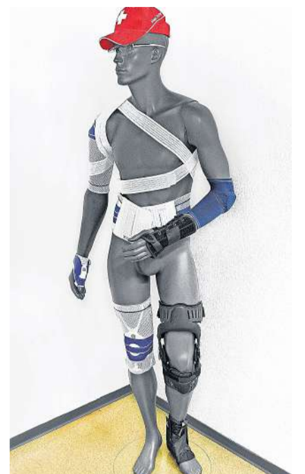
Testen Sie die neueste Generation von Entlastungsothesen bei W. Hägeli z.Vg.

Schmerzen und die damit verbundene Bewegungseinschränkung sind die entscheidenden Symptome bei Kniegelenkarthrose (Gonarthrose). Um die Beweglichkeit, Aktivität und Lebensqualität zu erhalten, ist die Schmerzlinderung das A und O in der Therapie. Gleichzeitig gilt es, operative Eingriffe und ein künstliches Kniegelenk (Endoprothese) hinauszuzögern sowie die Einnahme von Medikamenten zu reduzieren. Durch Ernährung, Sport und das Vermeiden von Fehlbelastungen können Sie selbst vorbeugen und positiv der fortgeschrittenen Arthrose entgegenwirken. Orthopädische Hilfsmittel wie Knieorthesen entlasten und stabilisieren das Kniegelenk und können dadurch signifikant die Schmerzen reduzieren. Es gibt zahlreiche Studien, die positive Behandlungsergebnisse für Gonarthroseorthese, insbesondere die Schmerzlinderung nachweisen können. Bei Patienten, die aus medizinischen Gründen nicht operationsfähig sind, kann eine Orthese eine Lösung sein, um das Knie zu entlasten, die Mobilität zu erhöhen und das Fortschreiten der