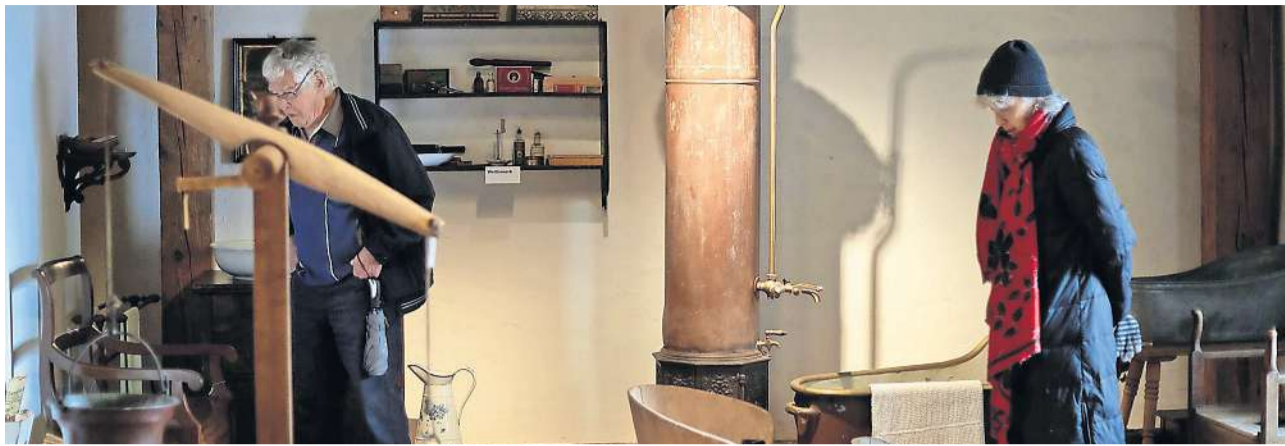
Eintauchen in Urgrossmutter's Zeit im Schaudepot St. Katharinental.